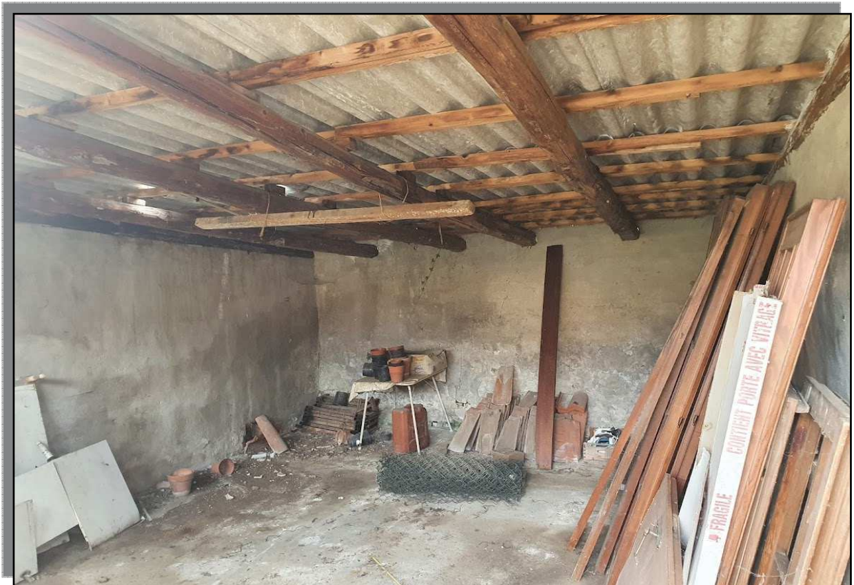
FOTO 16 _ AUTORIMESSA