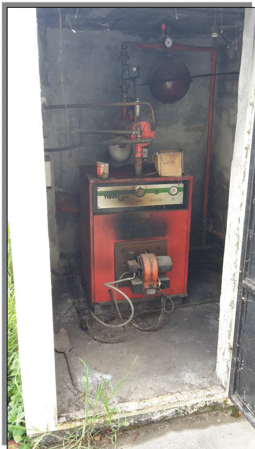
FOTO 17 _ VANO TECNICO