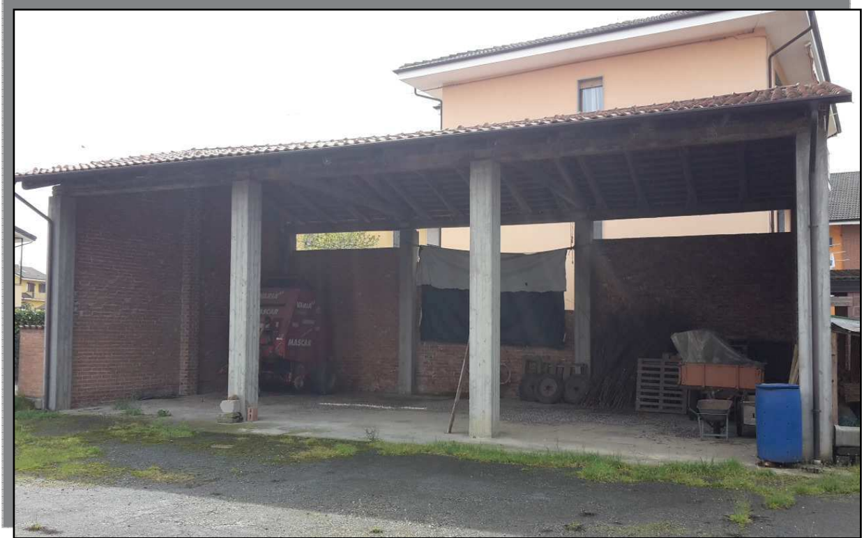
FOTO 15 _ PORTICO