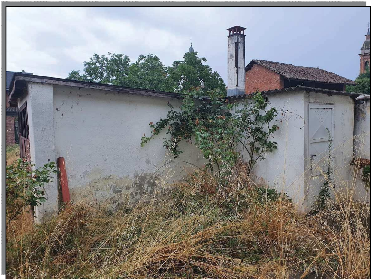
FOTO 13 _ FRONTE LATERALE NORD E VANO TECNICO