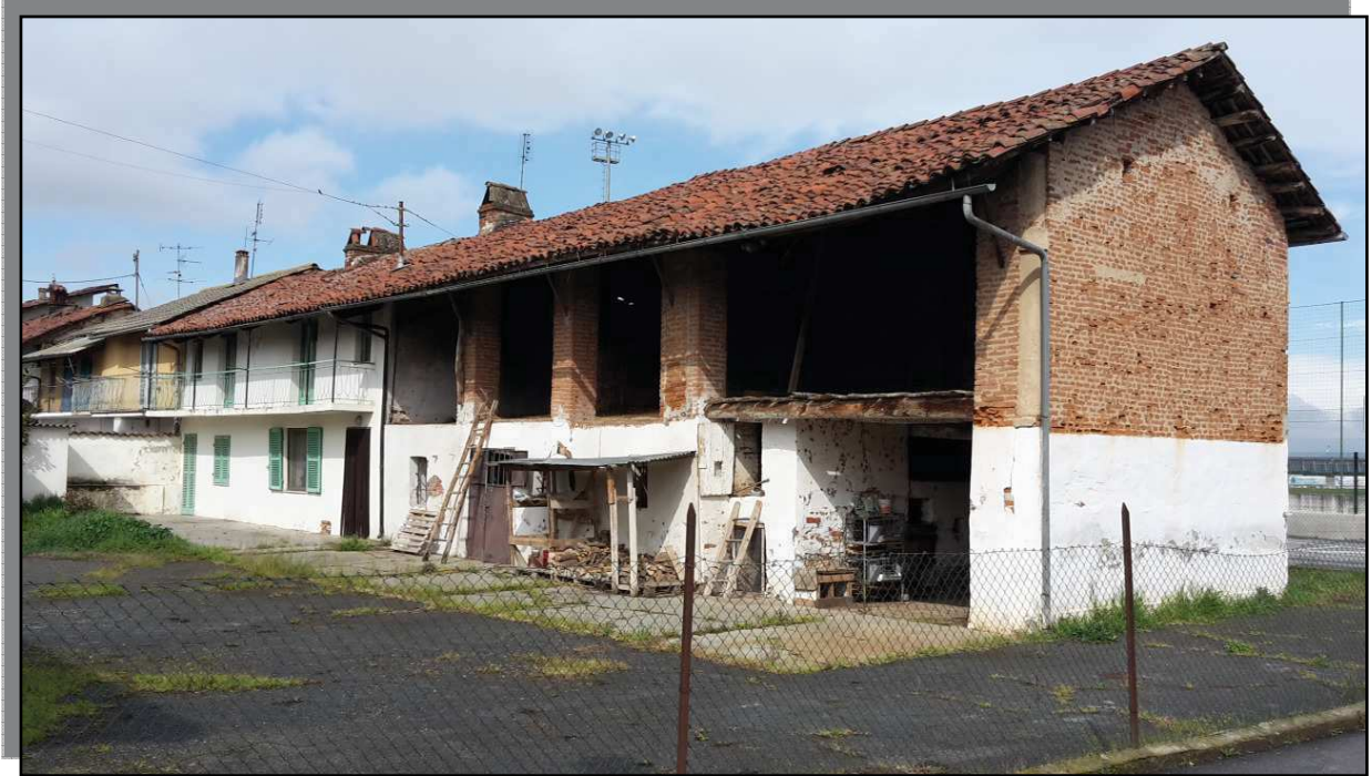
FOTO 2 _ FRONTE ANTERIORE SUD SU CORTILE