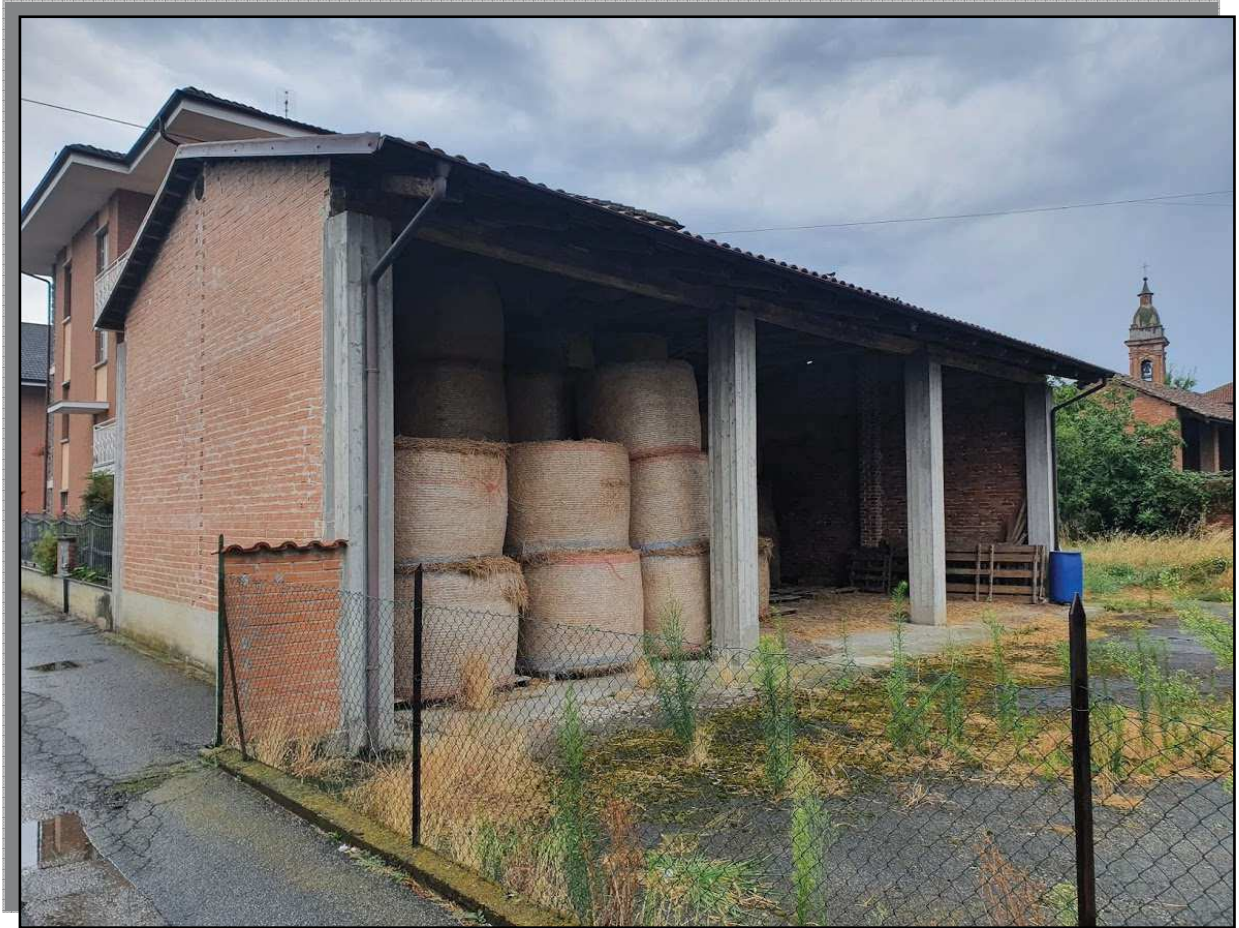
FOTO 9 _ FRONTE LATERALE EST SU CONFINE DI VIA PASCHERETTO E FRONTE NORD