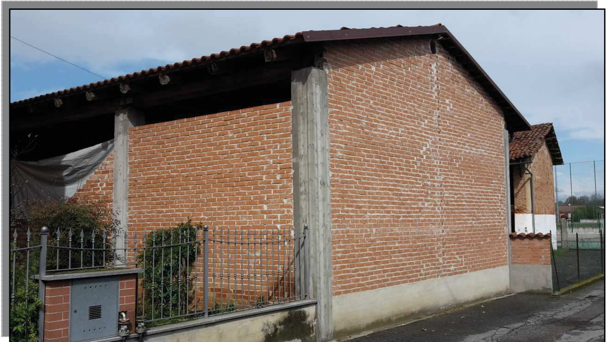
FOTO 8 _ FRONTE LATERALE EST E POSTERIORE SUD POSTI SU CONFINE DI PROPRIETÀ