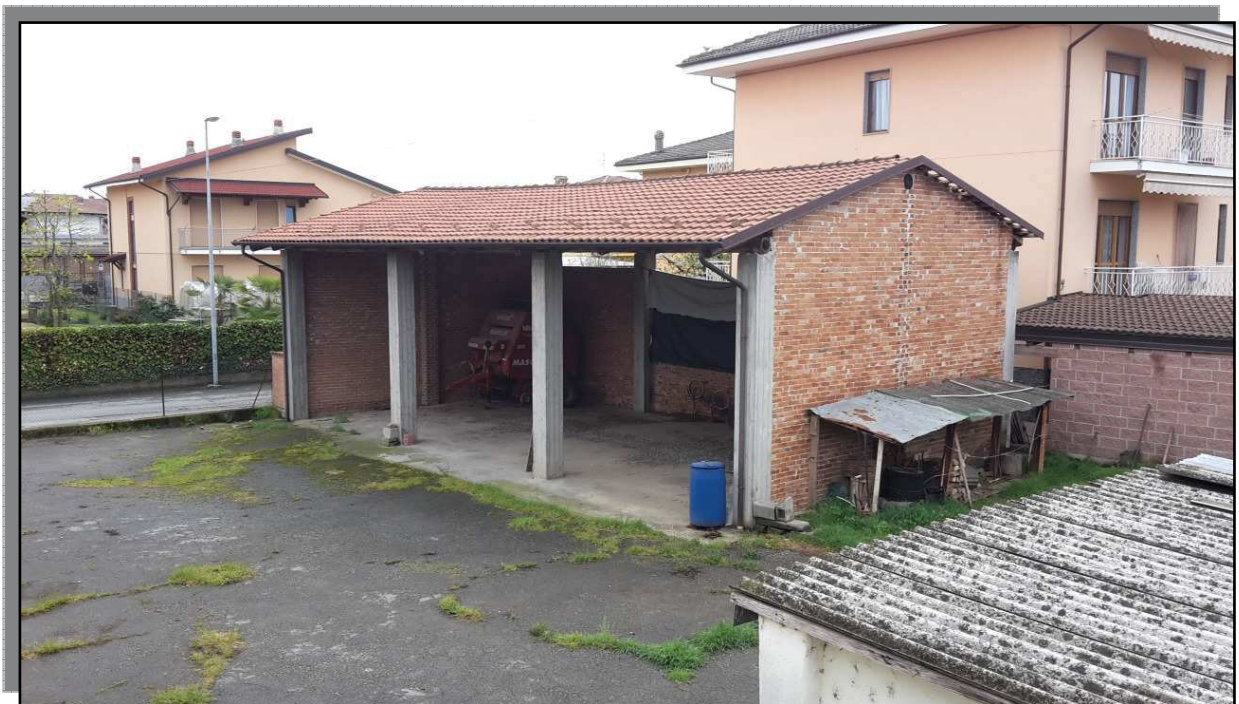
FOTO 10 _ FRONTE ANTERIORE NORD E FRONTE LATERALE EST