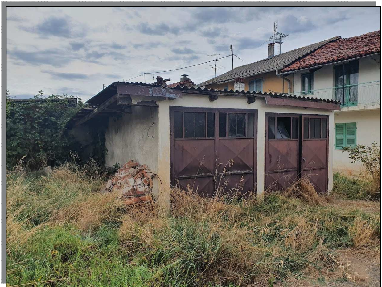
FOTO 12 _ FRONTE LATERALE SUD E FRONTE EST DI INGRESSO (SU CORTILE)