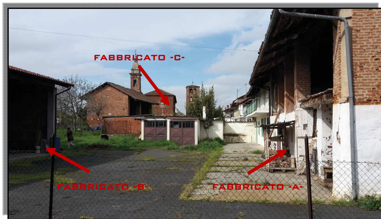
FOTO 1 _ VISTA D'INSIEME COMPARTO "PR 5" CON INDIVIDUAZIONE DEI FABBRICATI OGGETTO DI PIANO DI RECUPERO