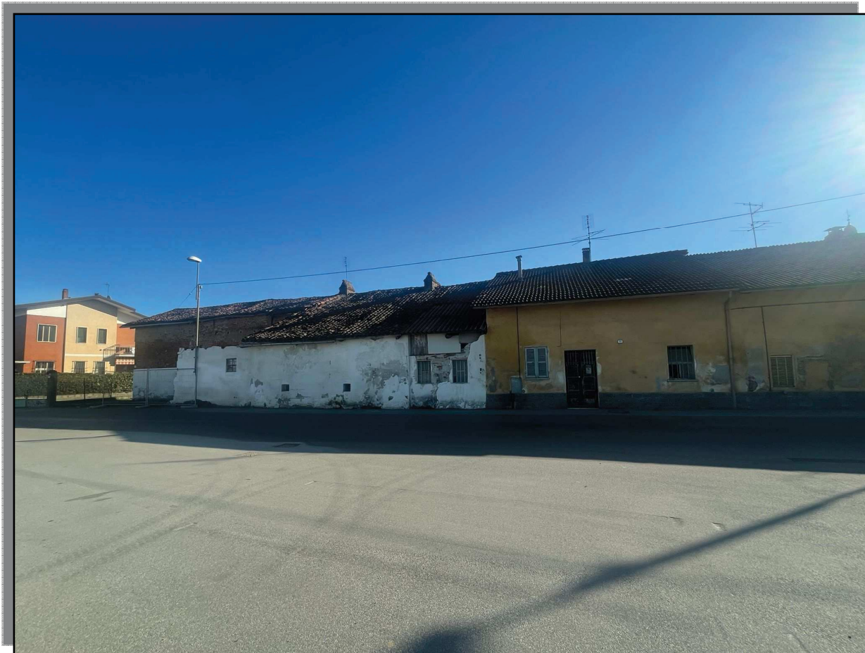
FOTO 6 _ FRONTE POSTERIORE NORD E VISTA SU VIA PASCHERETTO