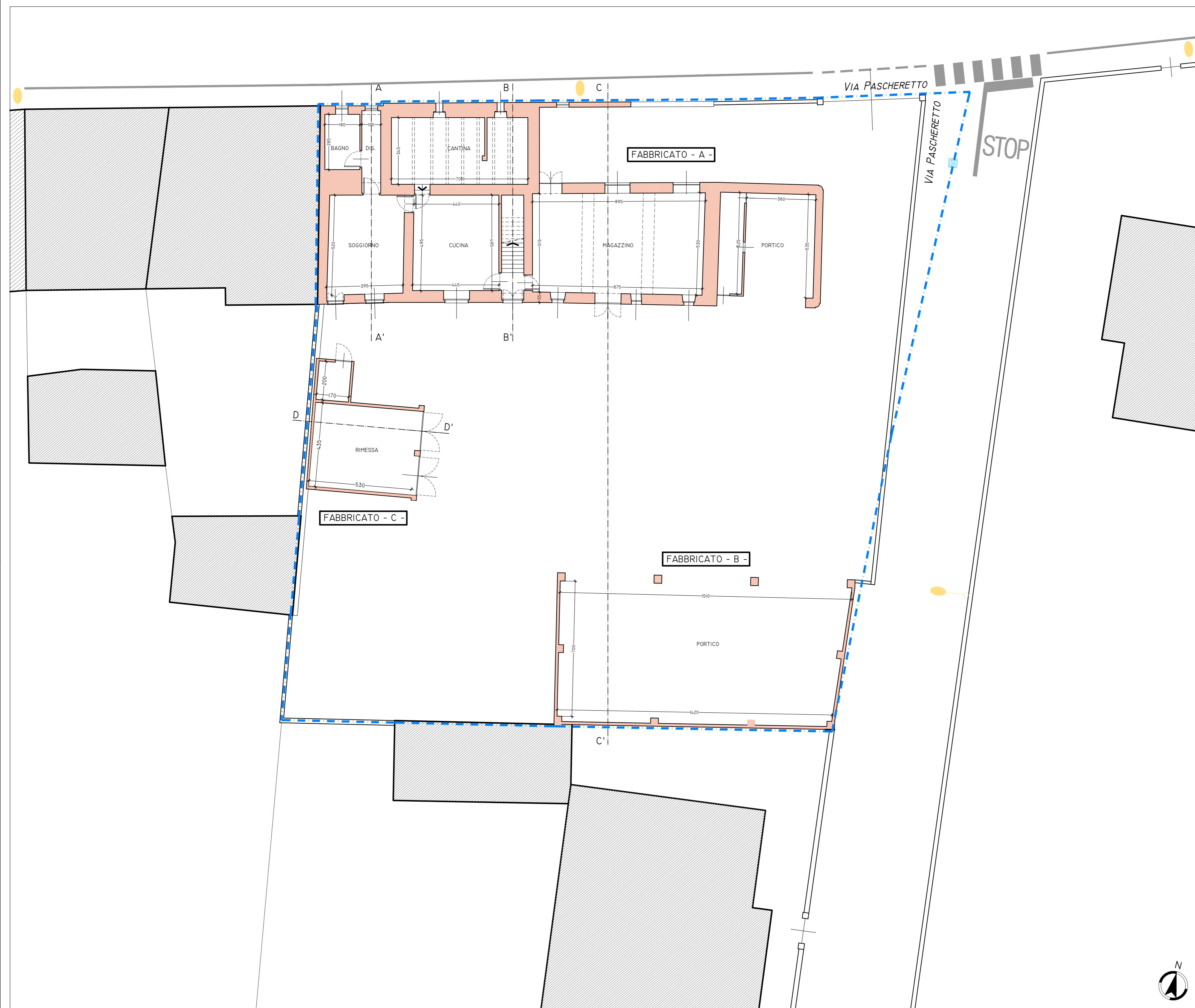
PLANIMETRIA PIANO TERRA

Disegno di proprietà dello Studio Roberto DOGLIANI e protetto a termini di Legge.