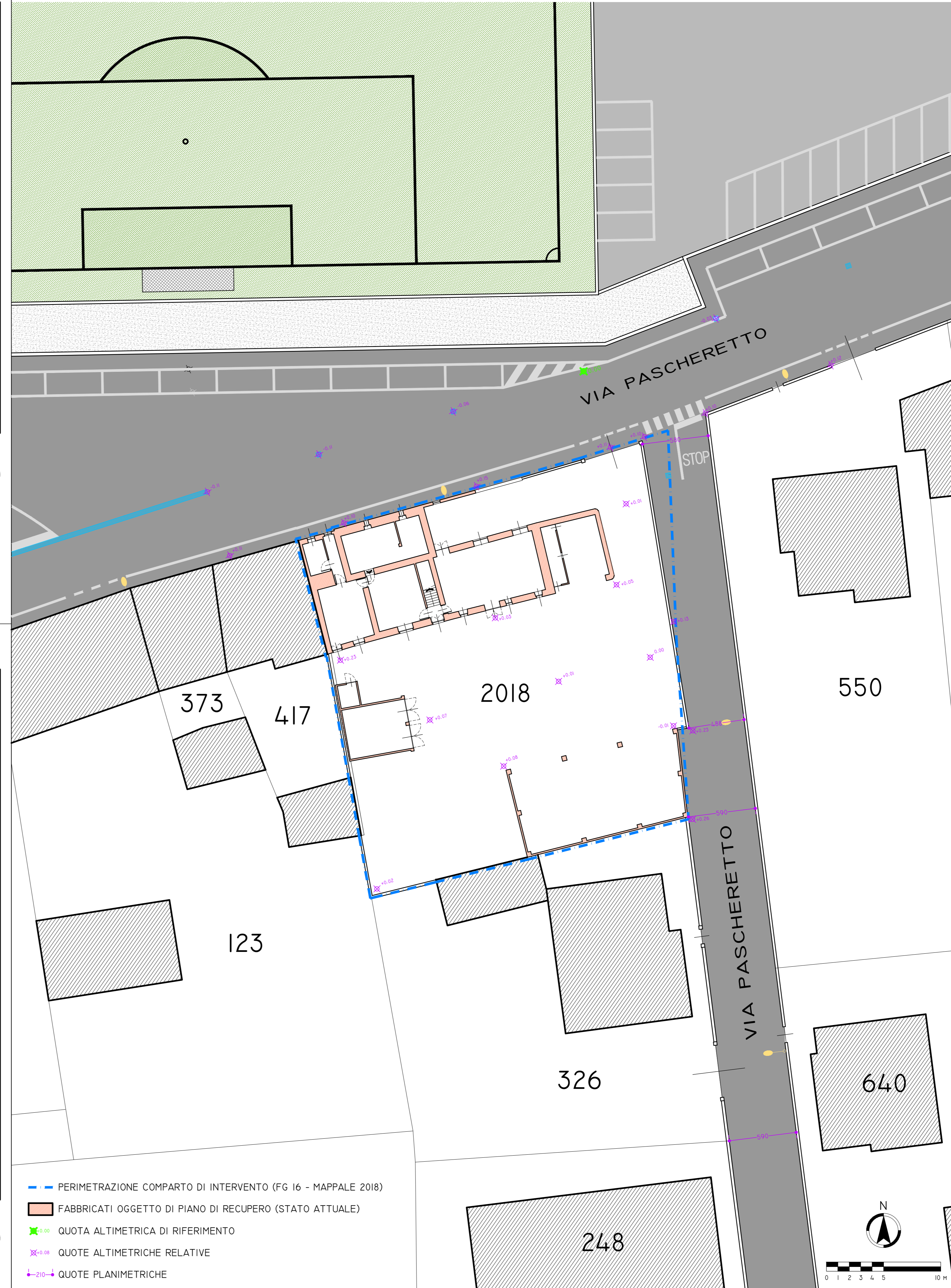
INGRANDIMENTO PLANO-ALTIMETRICO ESTESO AL CONTORNO DEL LOTTO - SCALA 1:200

— PERIMETRAZIONE COMPARTO DI INTERVENTO (FG I6 - MAPPALE 2018) ■ FABBRICATI OGGETTO DI PIANO DI RECUPERO (STATO ATTUALE) * QUOTA ALTIMETRICA DI RIFERIMENTO * QUOTE ALTIMETRICHE RELATIVE * QUOTE PLANIMETRICHE